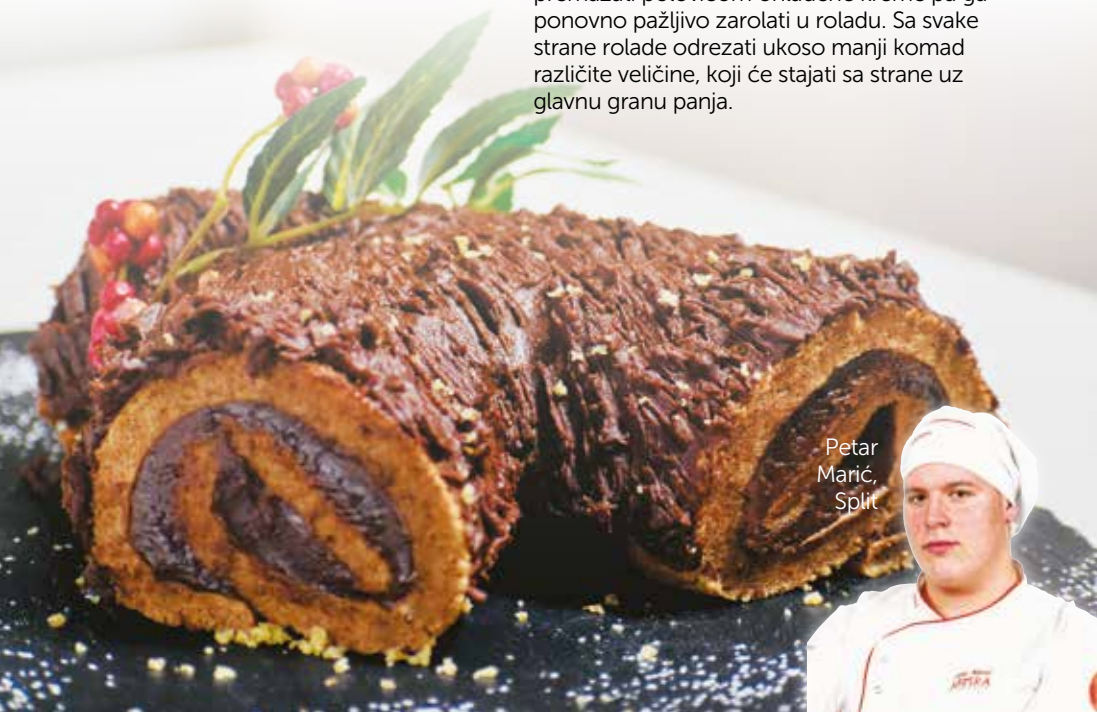
Petar Marić, Split

Popržiti orahe te ih sitno samljati. Otopiti 50 g maslaca te ohladiti. Zagrijati pećnicu na 180 stupnjeva. U zdjelu prosijati brašno i kakao u prahu i dobro promiješati. U drugu posudu miješati žumanjke i šećer. U smjesu dodavati orahe, brašno i kakao, maslac i javorov sirup. Na kraju umiješati posebno tučeni snijeg od bjelanjaka. Smjesu ravnomjerno rasporediti u pleh za pečenje te peći u ugrijanoj pećnici 15 minuta. Na radnu površinu staviti papir za pečenje te ga posuti šećerom u prahu. Na njega okrenuti tek pečeni biskvit da se šećer primi za biskvit. Biskvit zarolati u roladu te na njega staviti vlažnu kuhinjsku krpu i pustiti da se ohladi. Za ganache kremu zagrijati slatko vrhnje, dodati čokoladu na komadiće pa je uz miješanje otopiti u slatkom vrhnju. Ganache potpuno ohladiti uz povremeno miješanje kako bi se krema lijepo zgusnula i kako bi postala maziva. Ohlađeni biskvit odrolati, premazati polovicom ohlađene kreme pa ga ponovno pažljivo zarolati u roladu. Sa svake strane rolade odrezati ukoso manji komad različite veličine, koji će stajati sa strane uz glavnu granu panja.