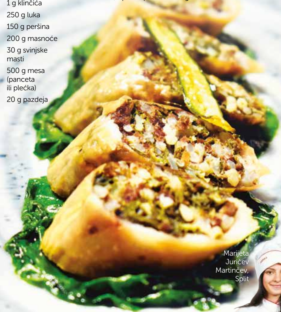
Marijeta Juričev Martinčev, Split

Isjeckati blitvu, luk, peršin, pazdeji i meso na komadiće i staviti u veću posudu. U istu posudu dodati sol, papar, ljutu i slatku papriku, oraščić, klinčiće, masnoću i svinjsku mast. Sve dobro pomiješati i dodati rižu. Nakon toga dodati vruću vodu i miješati kako bi se riža skuhalo. Kad se doda sva voda, puniti crijeva i pripremiti ih za kuhanje. U kipućoj vodi kuhati 20 minuta, a na pola kuhanja čačalicom pustiti svu vodu koja se nakupila u crijevu. Kad je skuhan, izvaditi na lim i ostaviti 20 minuta da se ohladi. Ohlađeni kulen popržiti na tavi, ispeći u pećnici ili na grilu.