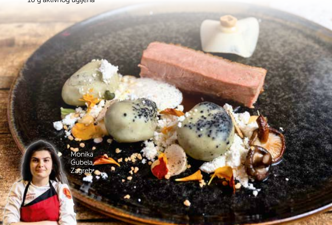
Monika Čubela Zagreb

Nasjeckati ljutiku i dodati vino te vrhnje. Nakon što prokuha, skinuti ga s izvora topline i pustiti da infuzira 15 - 20 minuta te dodati lecitin i izblendati štapnim mikserom.